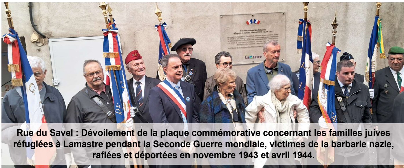
Rue du Savel : Dévoilement de la plaque commémorative concernant les familles juives réfugiées à Lamastre pendant la Seconde Guerre mondiale, victimes de la barbarie nazie, raflées et déportées en novembre 1943 et avril 1944.