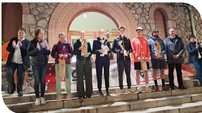
Podium 5,30 km