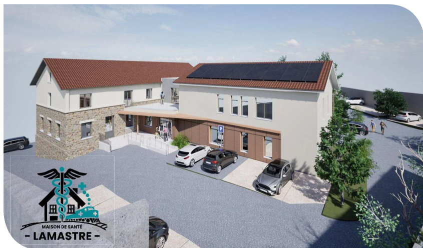
Future maison de santé, avenue Elisée Charra