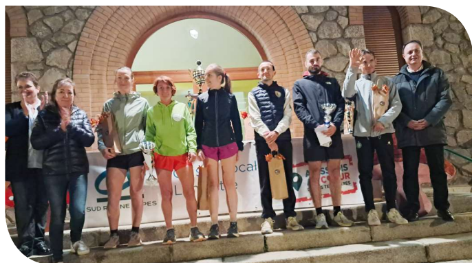
Podium 10,60 km